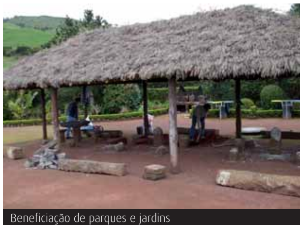
Beneficiação de parques e jardins