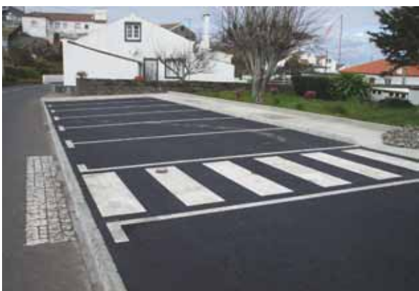
Pavimentação do parque de estacionamento do Museu Escolar