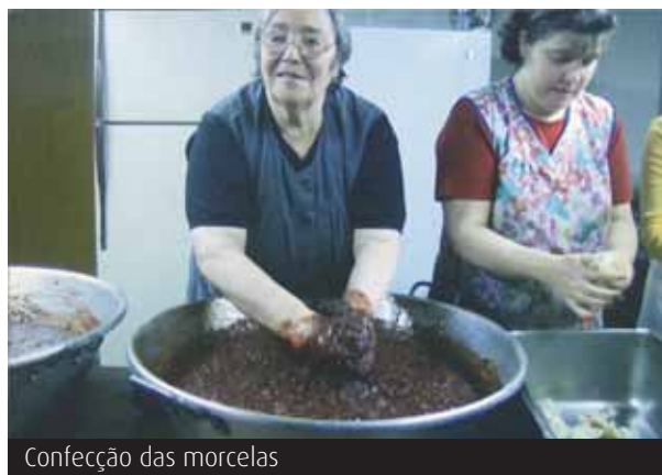
Confecção das morcelas