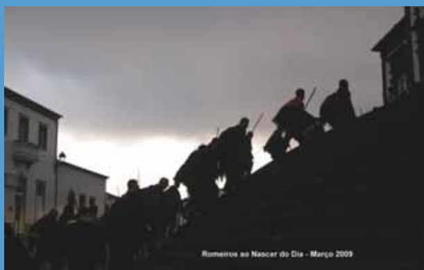
Romeiros ao Nascer do Dia - Março 2009

e, de pronto, se organizou uma procissão de acção de graças. Da continuidade, ao longo dos anos, e da ligação do espírito da regeneração da alma à penitência da Quaresma, resultou a passagem de procissão a romaria quaresmal e mantém hoje ainda grande autenticidade.