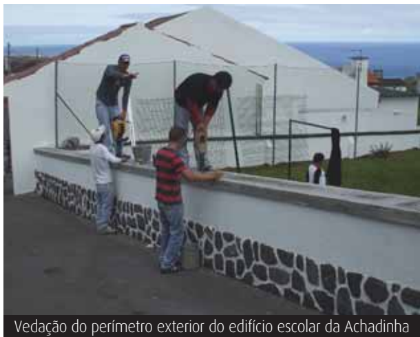
Vedação do perímetro exterior do edifício escolar da Achadinha