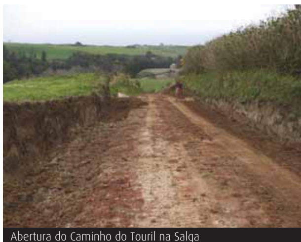
Abertura do Caminho do Touril na Salga