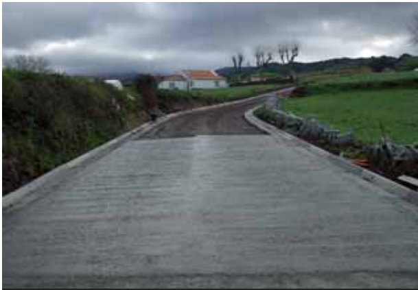
Pavimentação do Caminho do Canto na Achada