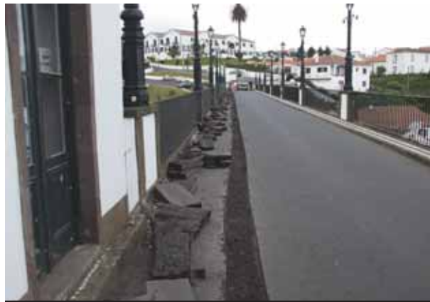
Reabilitação de passeios na Vila