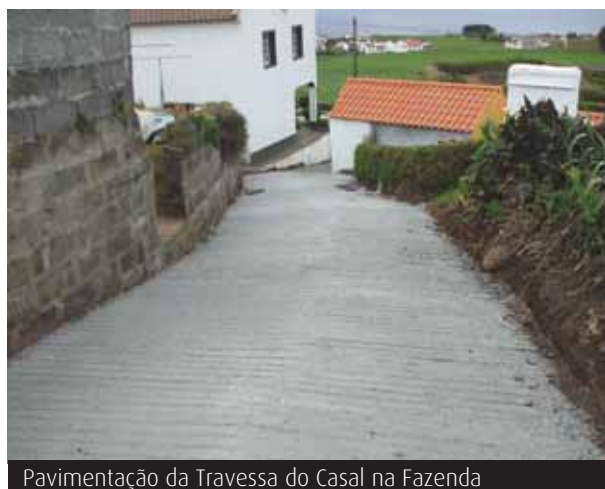
Pavimentação da Travessa do Casal na Fazenda