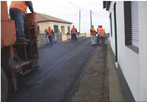
Pavimentação em slurry-seal na Fazenda