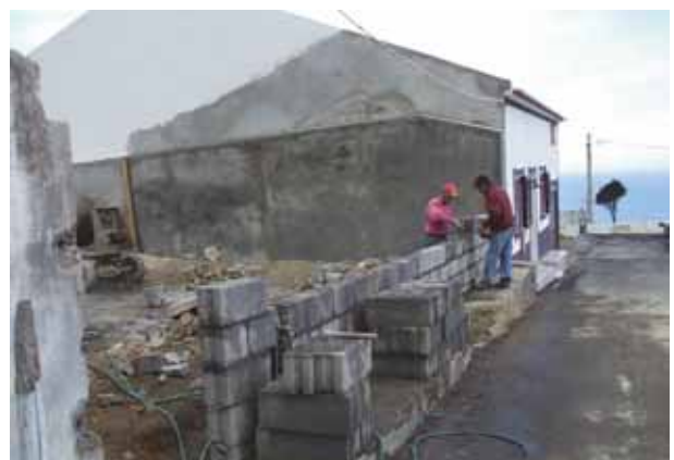
Demolição de moradia em ruínas