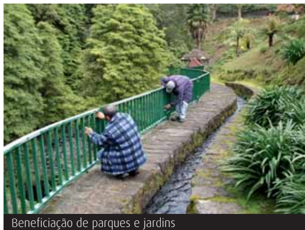
Beneficiação de parques e jardins