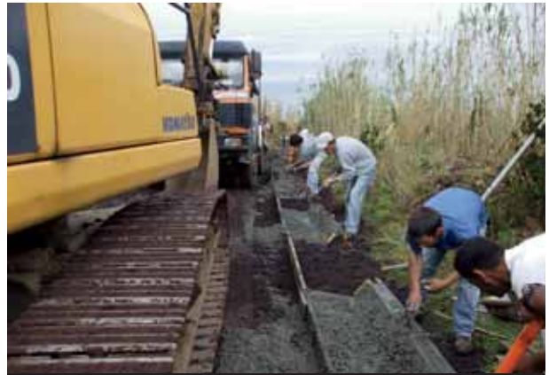
Pavimentação do Caminho do Baião em São Pedro