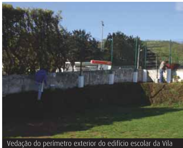
Vedação do perímetro exterior do edifício escolar da Vila