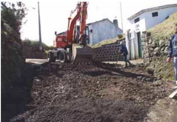
Pavimentação do caminho do Tabuleiro na Fazenda