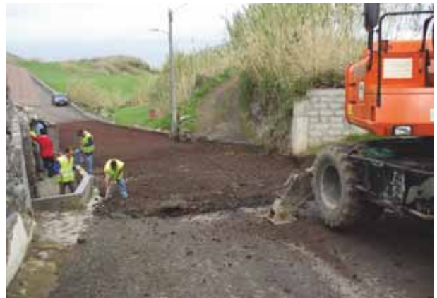
Pavimentação da Rua Direita em Santana