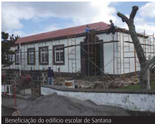
Beneficiação do edifício escolar de Santana

A grande beneficiação das escolas do primeiro ciclo é outra obra em curso, neste momento com intervenções no edifício escolar de Santana. Pequenas obras são igualmente feitas em todos os estabelecimentos do concelho, tendo recentemente sido vedados os pátios das escolas da Vila e da Achadinha.