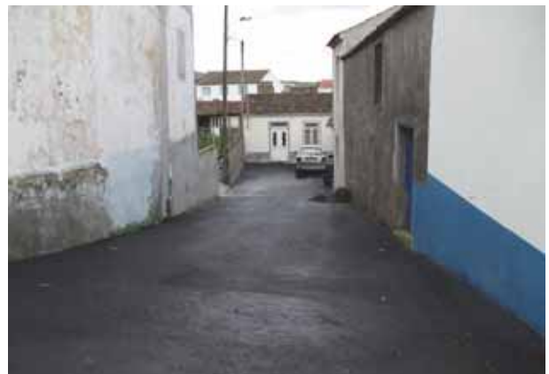
Pavimentação da Travessa da Vitória na Salga