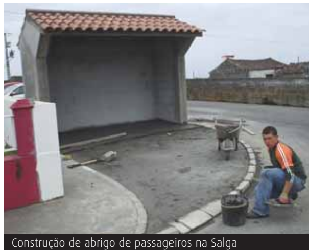
Construção de abrigo de passageiros na Salga