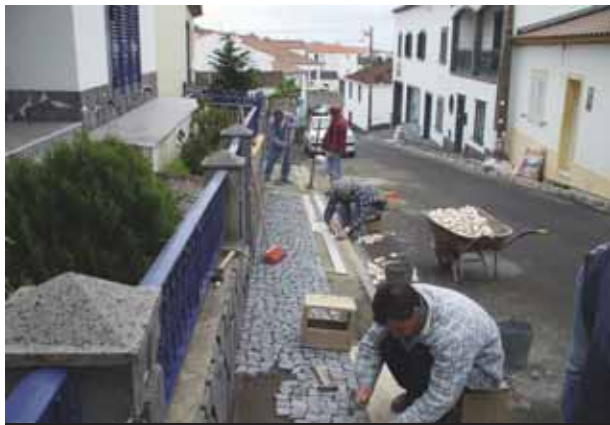
Reabilitação de passeios na Vila