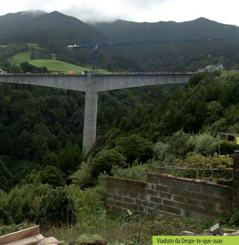
Viaduto da Despe-te-que-suas