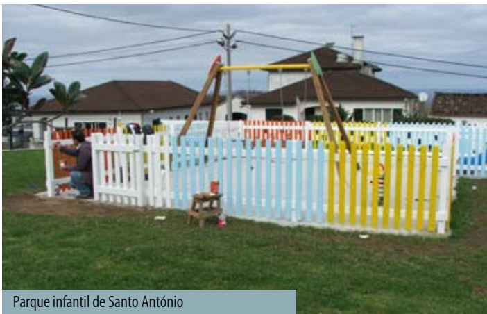
Parque infantil de Santo António