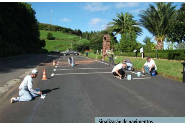
Sinalização de pavimentos