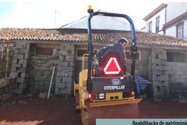
Reabilitação de património municipal na Vila e Algarvia