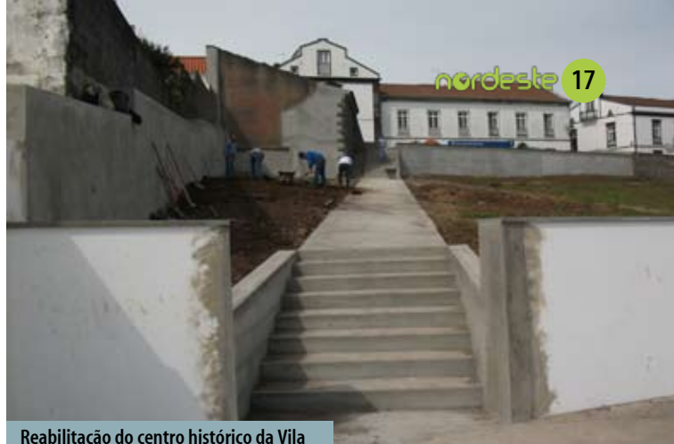
Reabilitação do centro histórico da Vila