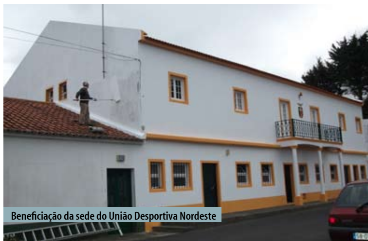
Beneficiação da sede do União Desportiva Nordeste