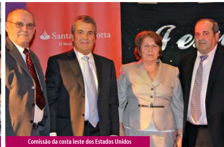
Comissão da costa leste dos Estados Unidos