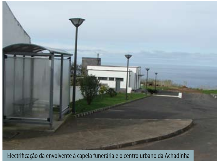
Electrificação da envolvente à capela funerária e o centro urbano da Achadinha