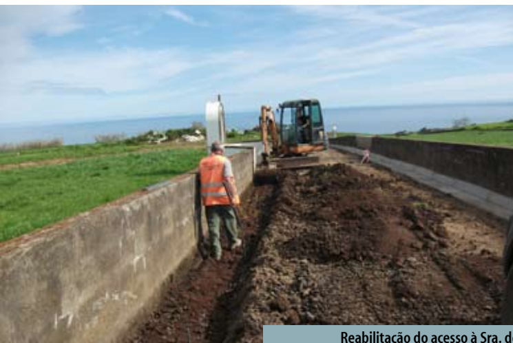
Reabilitação do acesso à Sra. do Pranto, largo e estacionamento