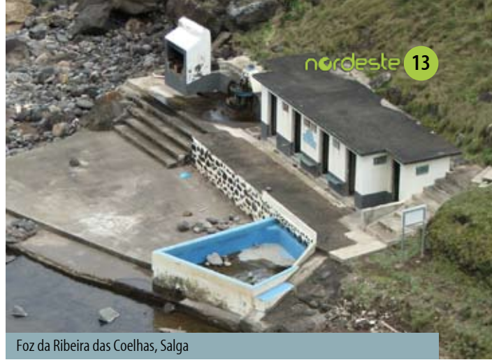
Foz da Ribeira das Coelhas, Salga

A câmara municipal transferiu para as juntas de freguesia 255 mil euros com vista à execução de obras nas freguesias. São as juntas que executam as obras, ficando a câmara com a responsabilidade do financiamento, sendo este feito por tranches. Algumas das obras ao abrigo deste protocolo de colaboração já estão em execução e outras concluídas, como sejam, a reabilitação da Foz da Ribeira das Coelhas (zona balnear e envolvente) na Salga, a electrificação da envolvente à capela funerária e o centro urbano da Achadinha, a recuperação e beneficiação do parque infantil de Santo António, a construção do parque de estacionamento da escola, em São Pedro, o parque de estacionamento da Rua da Igreja na Lomba da Fazenda, e a execução do Teatro da Grota do Bravo, na Vila do Nordeste. Seguem-se outras obras nas restantes freguesias, concretamente, a reabilitação de parques infantis na Algarvia, a reabilitação dos teatros da Feteira Grande e Feteira Pequena, e reconstrução do reservatório de água da Estrada Regional na freguesia da Achada.