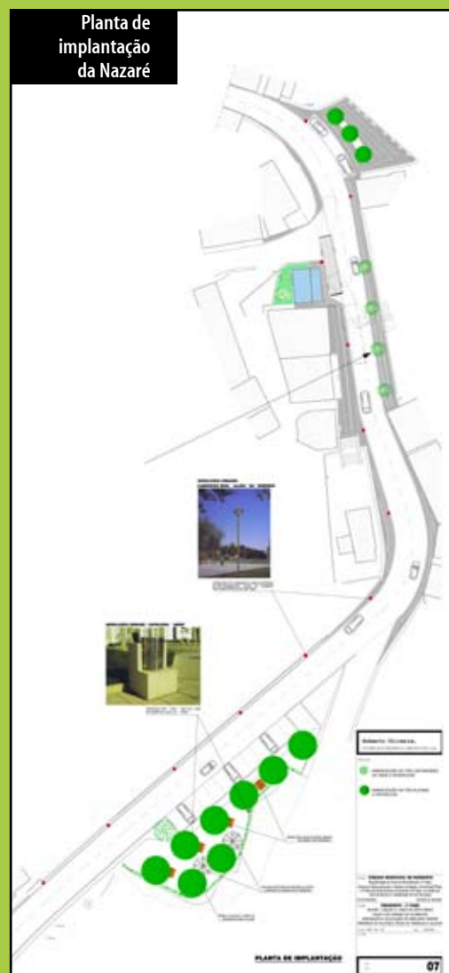
Planta de implantação da Nazaré

A beneficiação, no seu conjunto, enobrecerá esta zona da Vila do Nordeste, lugar pitoresco pela vista soberba que oferece sobre o mar e para o Farol do Arnel, para além de trazer melhores condições e novas infra-estruturas aos residentes deste local.