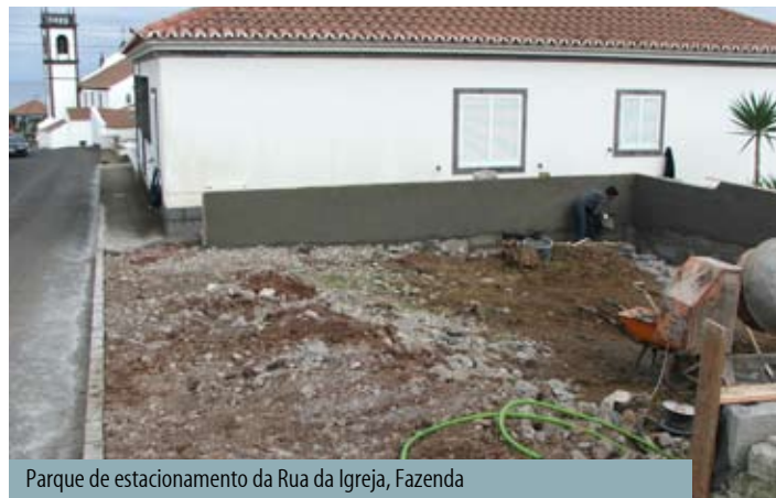
Parque de estacionamento da Rua da Igreja, Fazenda