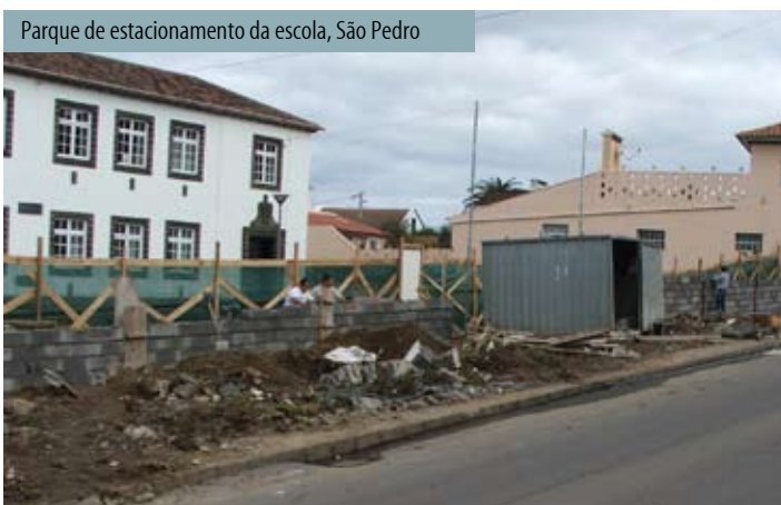
Parque de estacionamento da escola, São Pedro