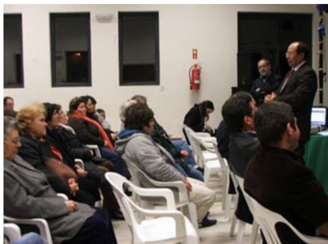
Planos de Pormenor da Salga e da Vila salvaguardados

Na revisão do PDM foi efectuada a compatibilização da mesma com os outros planos municipais, designadamente, o Plano de Pormenor da Vila do Nordeste, que permitirá a expansão do centro urbano da sede do concelho, e o Plano de Pormenor da Salga, este último de importância para a freguesia por vir resolver definitivamente a legalização de chãos de um grande número de habitações.