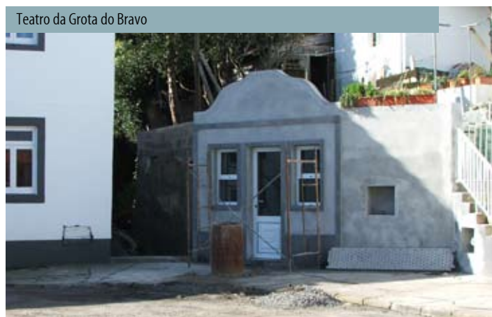
Teatro da Grota do Bravo