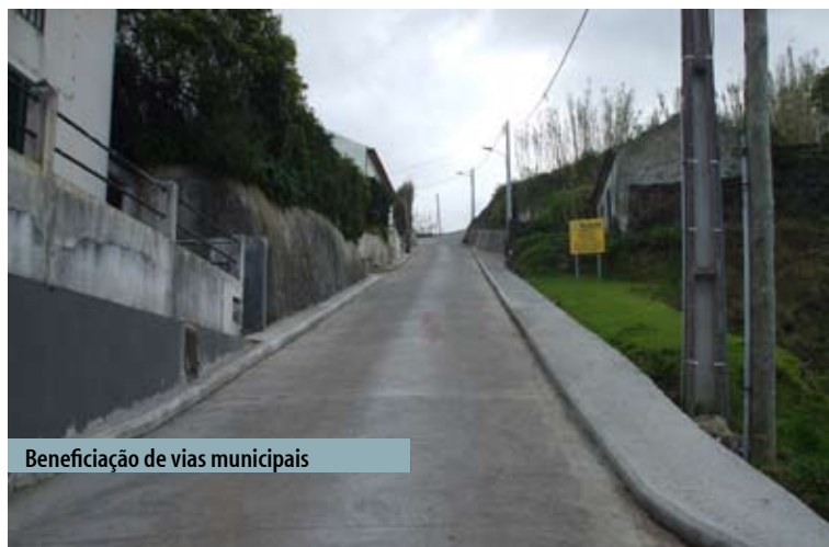
Beneficição de vias municipais