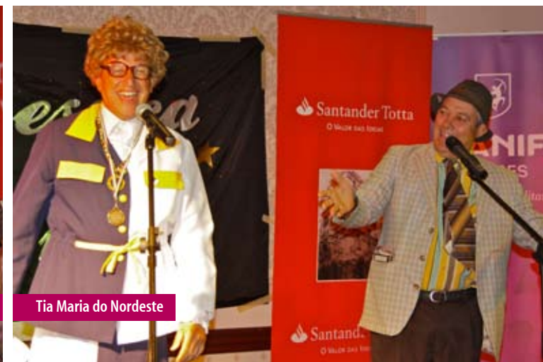
Tia Maria do Nordeste