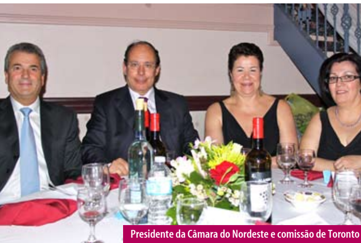
Presidente da Câmara do Nordeste e comissão de Toronto