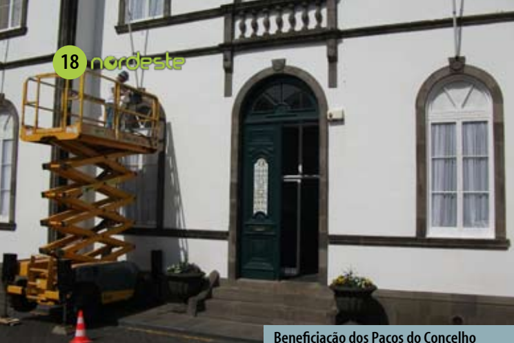
Beneficiação dos Paços do Concelho