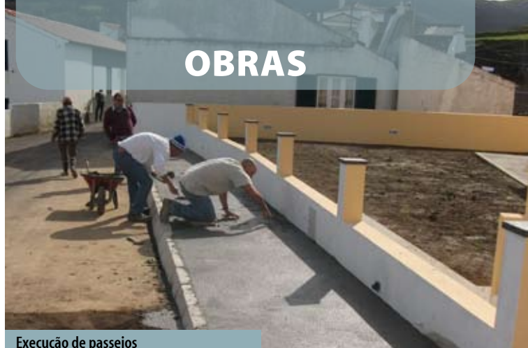
Execução de passeios