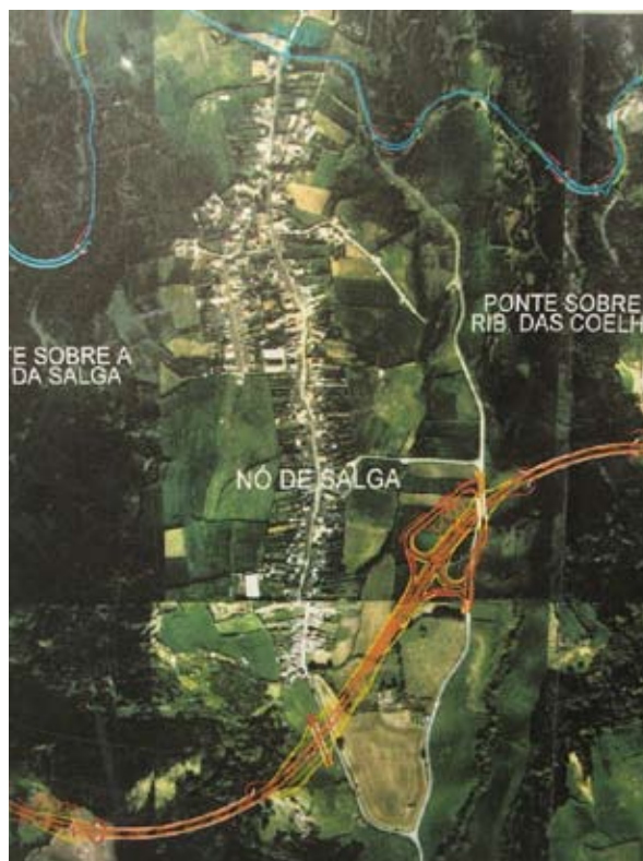
1ª Traçado da SCUT contemplava ligação à freguesia da Salga e restantes freguesias