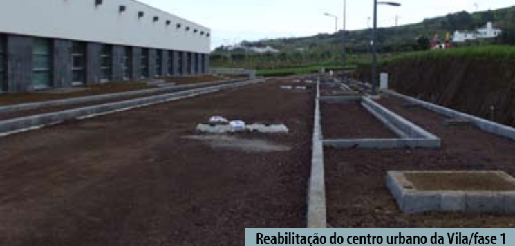
Reabilitação do centro urbano da Vila/fase 1