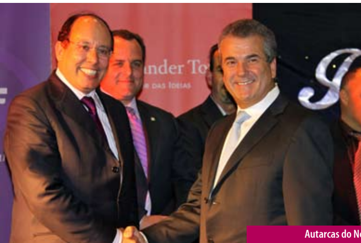
Autarcas do Nordeste e comissão