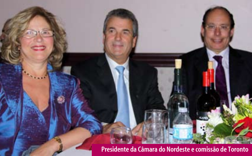
Presidente da Câmara do Nordeste e comissão de Toronto