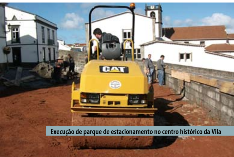
Execução de parque de estacionamento no centro histórico da Vila