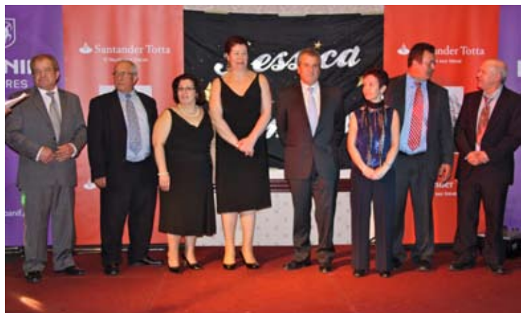
Comissão organizadora de Toronto