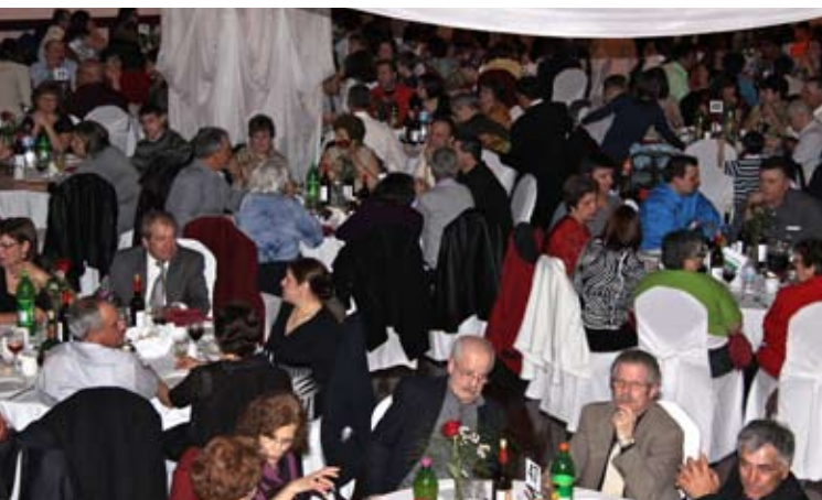
Encontro junta mais de 700 pessoas

Na deslocação a Toronto, o presidente da Câmara do Nordeste foi entrevistado pelas duas estações de rádio e televisão portuguesas (CIRV) com maior audiência no Canadá, ouvidos por mais de 300 mil portugueses. Estas participações são aproveitadas pelo presidente da câmara para dar a conhecer o concelho e atrair visitantes,