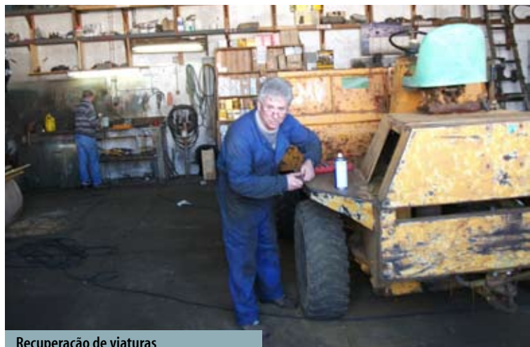
Recuperação de viaturas