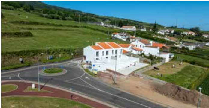
Construção de Três Moradias Unifamiliares, sitas à Rua Padre José Pacheco Monte – Vila de Nordeste – obra concluída