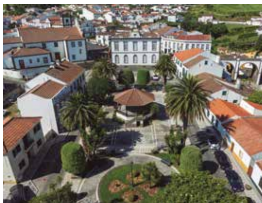
Reparação de calçada do jardim, passeios e arruamentos nas ruas envolventes ao Jardim do Município - Vila do Nordeste

Os preparativos para as maiores festas do concelho também ocupam uma parte significativa da mão de obra afeta ao parque de máquinas da câmara.