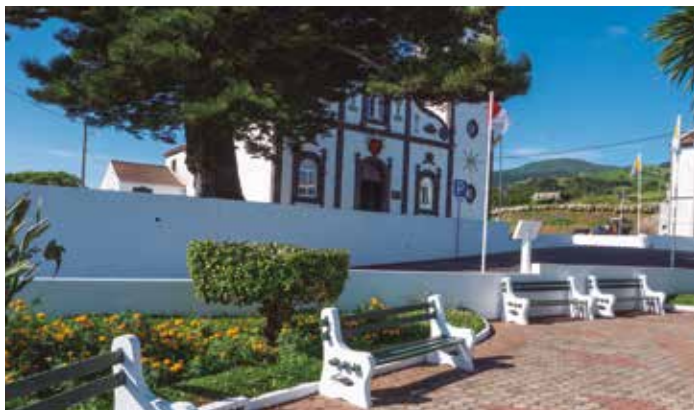
Pintura geral de muros da localidade, coreto e jardim - Lomba da Pedreira