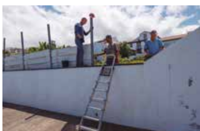
Preparação do Largo do Jogo da Choca para as festas do concelho - Vila do Nordeste