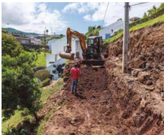
Construção de Muro de Suporte na Rua Visconde da Palmeira, Vila de Nordeste, no âmbito da Obra de Reabilitação/ Construção de Paredões e Enrocamentos para Proteção de Caminhos e/ou Trilhos Existentes – em execução