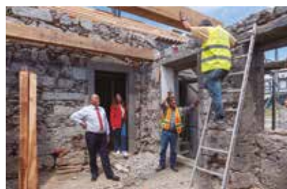
Requalificação da Praça Central de Santana, no Âmbito da Reabilitação do Edifício Municipal de Santana a Sede da Junta de Freguesia, Instalações Sanitárias Públicas e Praça – em execução