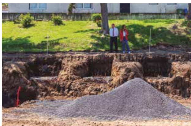
Construção de Campo de Jogos e Melhoria de Acessos no Tardoz da Escola Primária de Santo António de Nordestinho – em execução