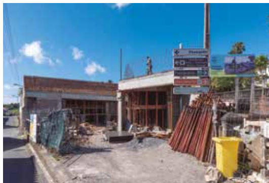
Requalificação do Mercado Municipal da Vila de Nordeste – em execução