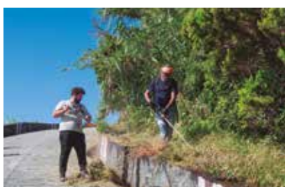
Podas e limpezas de arruamentos em todo o concelho