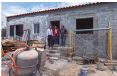
Beneficiação de moradia social na Achadinha