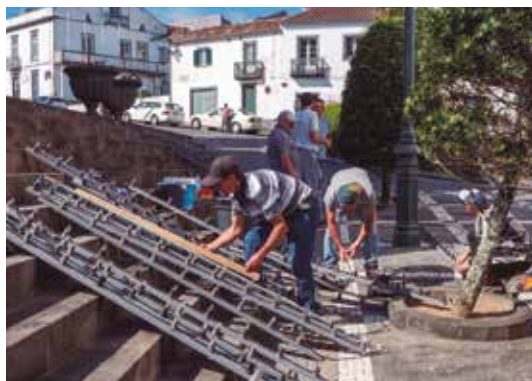
Preparação das iluminações para as festas do concelho Vila do Nordeste