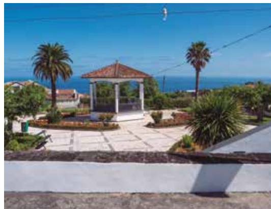
Pintura geral de muros da freguesia, coreto e jardim - São Pedro de Nordestinho