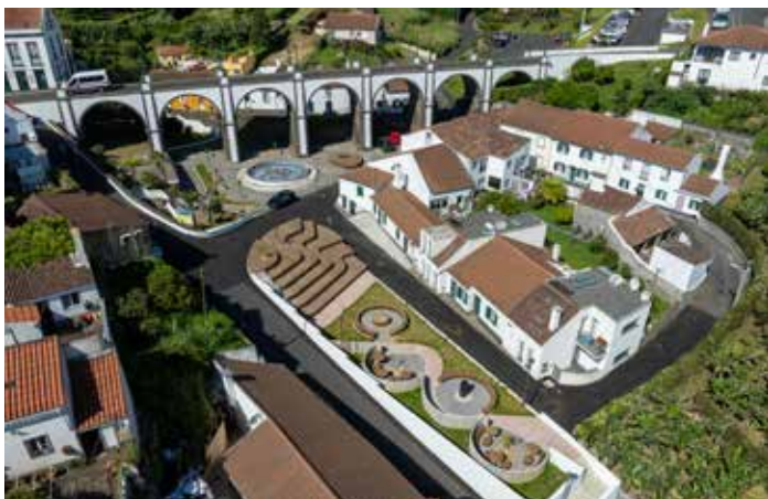
Requalificação do Parque e Jardim envolvente à Ponte dos Sete Arcos – Vila do Nordeste - obra concluída

Como habitualmente, o executivo camarário visitou as empreitadas em execução, inclusive, as empreitadas iniciadas mais recentemente nas freguesias de Santo António e de São Pedro Nordestinho.