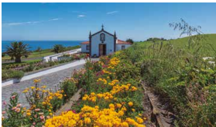
Beneficiação de pintura de muros da Ermida de NS do Pranto São Pedro de Nordestinho