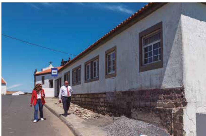
Reabilitação e Ampliação do Salão Paroquial de São Pedro de Nordestinho destinado ao Centro de Convívio – em execução