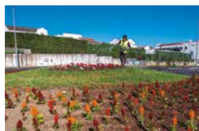
Manutenção de jardins e espaços verdes em todo o concelho