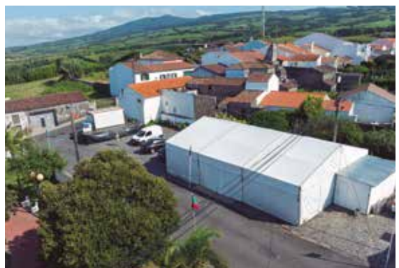
Montagem de tenda, barracas e eletrificações nas festas religiosas das freguesias