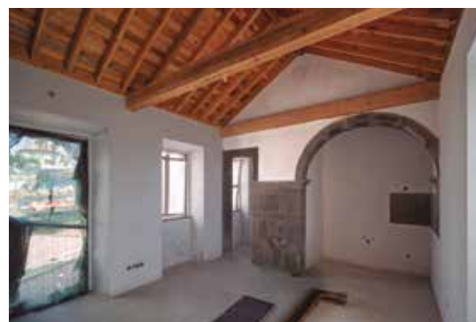
Empreitada de Requalificação da Praça Central de Santana, no Âmbito da Reabilitação do Edifício Municipal de Santana A Sede da Junta de Freguesia, Instalações Sanitárias Públicas e Praça – Em Execução