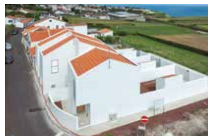
Empreitada de Construção de Infraestruturas Elétricas na Rua Padre José Pacheco Monte, Vila de Nordeste – Em Execução