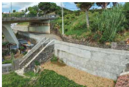
Empreitada de Construção de um Muro de Suporte na Rua Visconde da Palmeira, Vila de Nordeste.