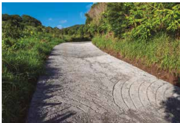
Pavimentação do Caminho do Pico na localidade da Pedreira, em colaboração com a junta de freguesia