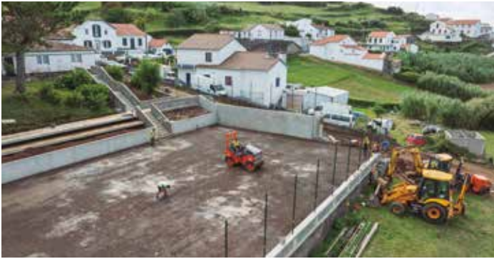
Empreitada de Construção de um Campo de Jogos e Melhoria de Acessos no Tardoz da Escola Primária de Santo António de Nordestinho Em Execução