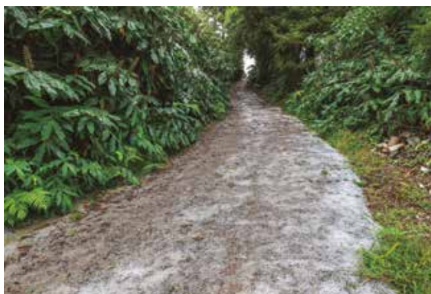
Pavimentação em betão da Grota Seca de Baixo na freguesia da Achadinha, em colaboração com a junta de freguesia