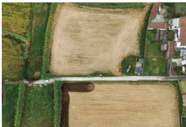
Pavimentação em betão do Caminho do Pesqueiro na freguesia da Achadinha, em colaboração com a junta de freguesia