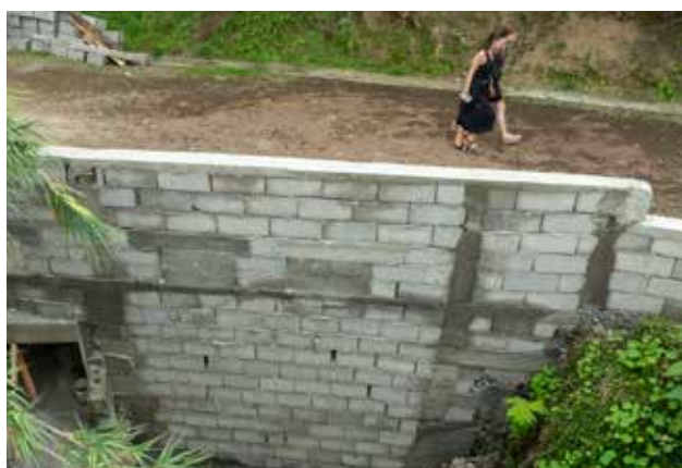
Execução de muro de suporte no "trilho do Poço Azul" na freguesia da Achadinha, em colaboração com a junta de freguesia