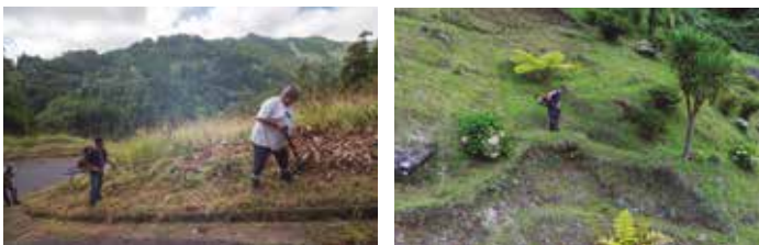
Manutenção de zonas verdes e jardins em todo o concelho