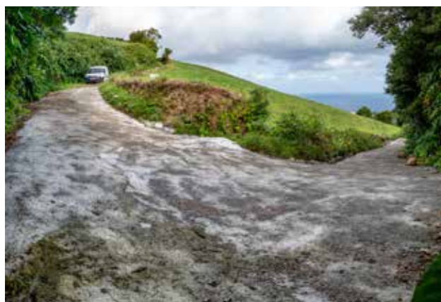
Pavimentação em betão do Caminho dos Criminosos em São Pedro de Nordestinho, em colaboração com a junta de freguesia