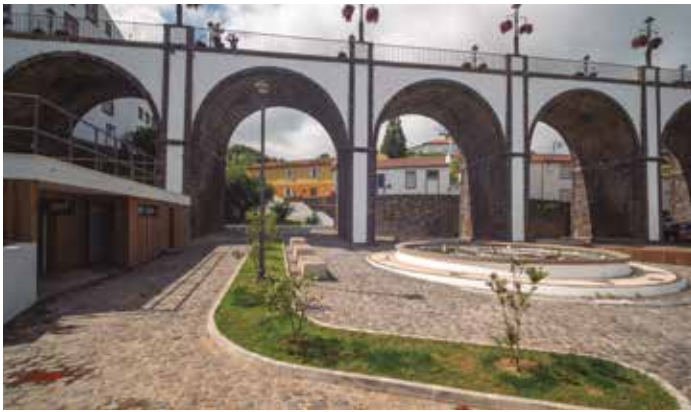
Reparação de calçada no Largo Debaixo da Ponte dos Sete Arcos Vila do Nordeste