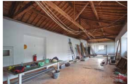
Empreitada de Reabilitação e Ampliação do Salão Paroquial de São Pedro de Nordestinho destinado ao Centro de Convívio de São Pedro de Nordestinho – Em Execução