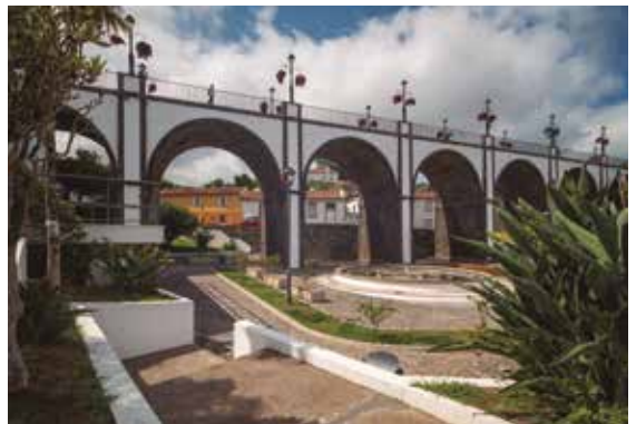
Ajardinamento do Parque dos Combatentes e Largo Debaixo da Ponte