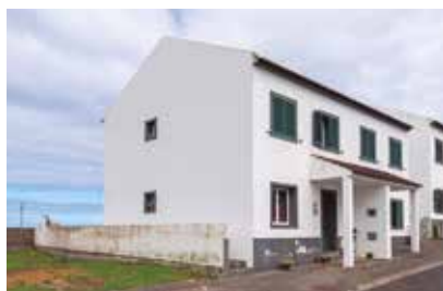
Empreitada de Beneficiação de duas Moradias sitas à Rua Nova n.º 18, freguesia da Achada e Rua da Leira n.º 8, freguesia da Lomba da Fazenda Em Execução