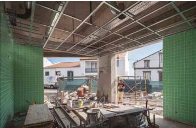
Empreitada de Requalificação do Mercado Municipal da Vila de Nordeste Em Execução