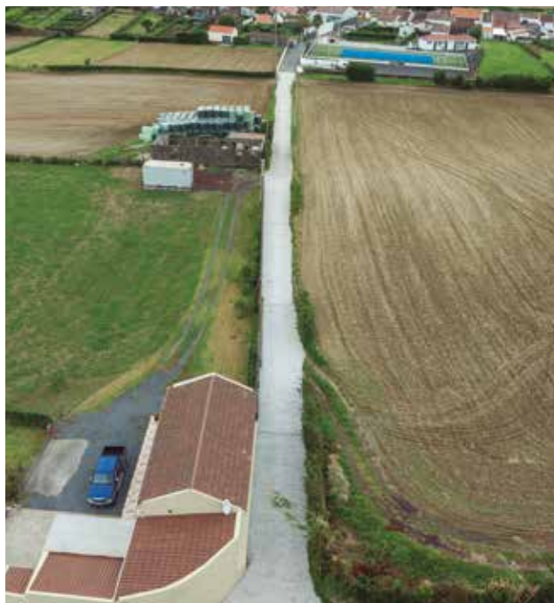
Pavimentação em betão do Caminho do Espigão na freguesia da Salga, em colaboração com a junta de freguesia